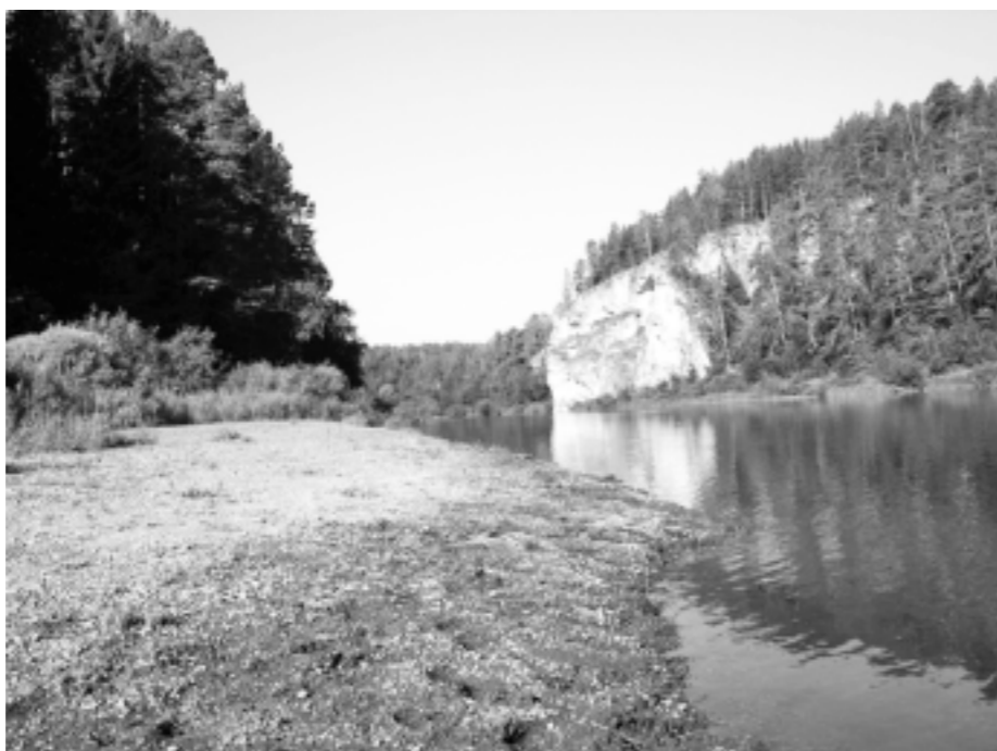
Вдоль реки Уфы стоят высокие скалы

После обеда мы пошли на гору, которая называется Зайкин камень. Мы очень долго пробирались по узкой и скользкой после дождя рыбацкой тропинке берегом реки, спотыкались