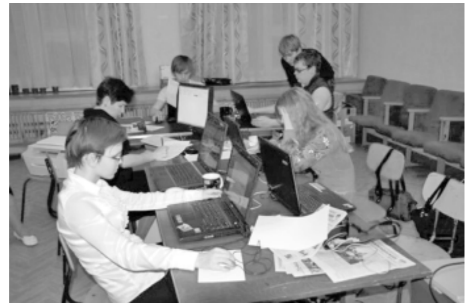
Пресс-центр фестиваля работает в круглосуточном режиме

Как всегда, запланированы мастер-классы для начинающих «акул» пера и камеры. Их проведут педагоги факультетов журналистики, ведущие журналисты СМИ области и Ураль-