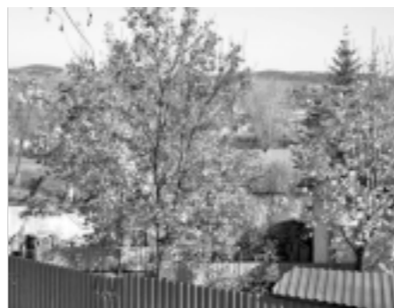
с деревьев. Совсем скоро в свои права вступит зима...

Не слышно ни голосов птиц, ни стрекотания кузнечиков, ни жужжания пчёл и жуков. Тишина... Даже гром уже не решается нарушить спокойствия природы, только заморосит тихий дождь, но уже не тёплый, летний, а холодный и грустный. Темнеет рано, вечера холодные, по утрам съезжившую траву покрывает иней. Ещё немного – и последние листики упадут